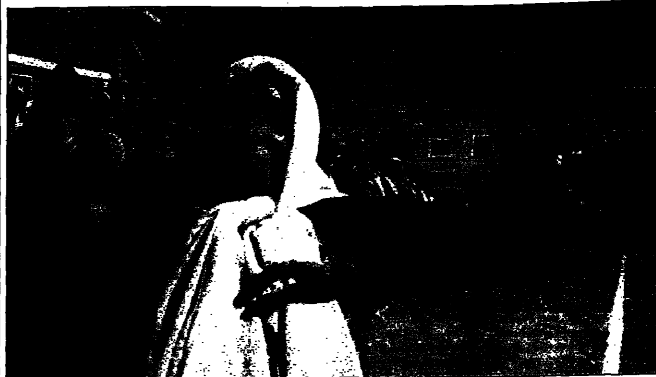
رجال دين مسيحيون يمشون وهم يرفعون امرأة فلسطينية ترثس وتبكي، خلال مسيرة يوم الأربعاء الفلسطيني ياسر عرفات في نابلس